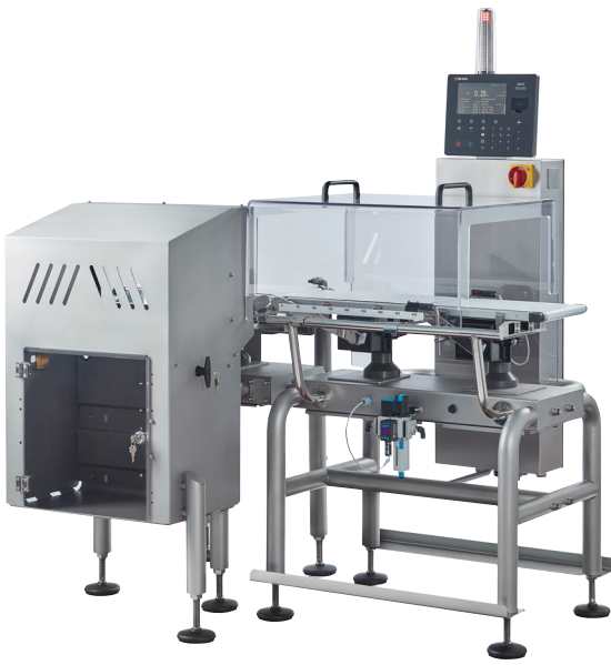
Exemple de système