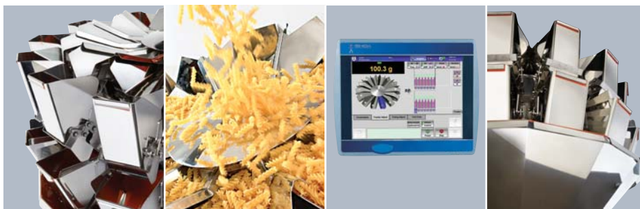
Größere Abfüllgenauigkeit, höhere Wirtschaftlichkeit